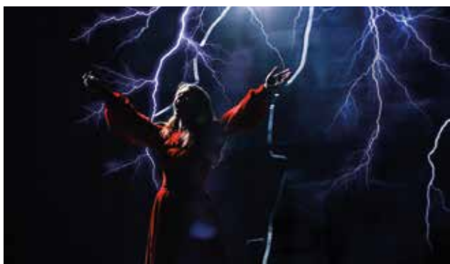
«ГРОЗА» 2, 8 ИЮНЯ / 5, 6 ИЮЛЯ