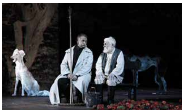
«ГУБЕРНАТОР» 28, 29 ИЮНЯ