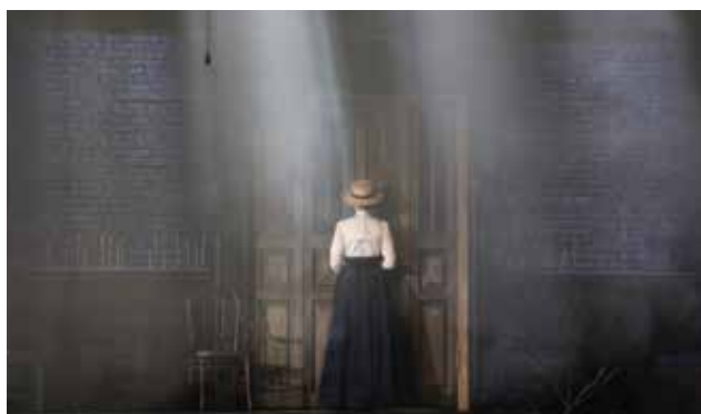
«ТРИ СЕСТРЫ» 3, 4 ИЮНЯ / 1 ИЮЛЯ