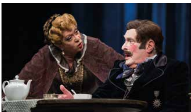
«ДЯДЮШКИН СОН» 12, 25 ИЮНЯ / 4 ИЮЛЯ

По многочисленным просьбам зрителей сезон 2016/17 года в БДТ будет дольше, чем обычно, — театр будет работать до 7 июля. В последние дни сезона мы покажем одни из самых популярных спектаклей — «Губернатора» , «Грозу» , «Три сестры» и «Дядюшкин сон» .